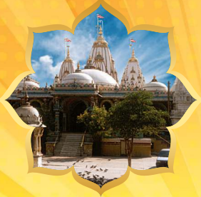
अमदावाढ मंदिर श्री नरनारायणदेव वि.सं. १८७८ (A.D. १८२२)