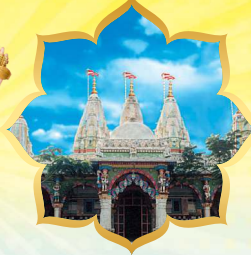
धोतेरा मंदिर श्री महनमोहनजु महाराज वि.सं. १८८२ (A.D. १८२६)