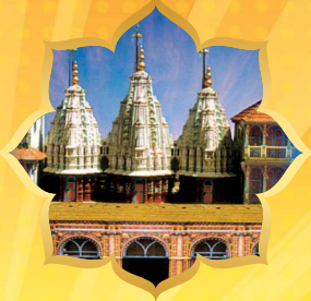
भूज मंदिर श्री नरनारायणदेव वि.सं. १८७९ (A.D. १८२३)