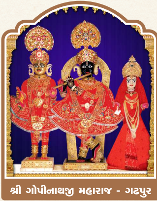
શ્રી ગોપીનાથજી મહારાજ - ગઢપુર