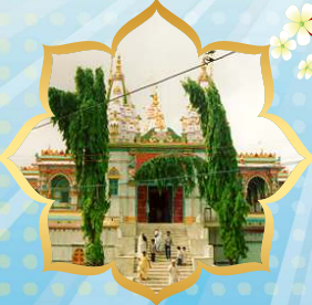
जुनागढ मंदिर श्री राधारामणदेव वि.सं. १८८४ (A.D. १८२८)