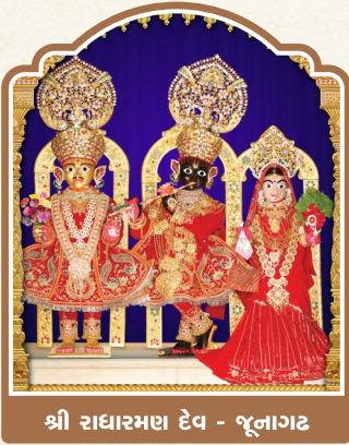
શ્રી રાઘારમણ દેવ - જૂનાગઢ