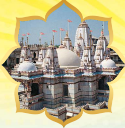
वडताव मंदिर श्री लक्ष्मीनारायणदेव वि.सं. १८८१ (A.D. १८२३)