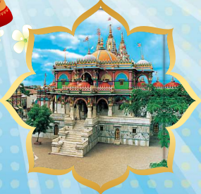
गढडा मंदिर श्री गोपीनाथजु महाराज वि.सं. १८८५ (A.D. १८२८)