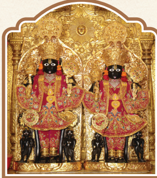
શ્રી નરનારાયણ દેવ - અમદાવાદ