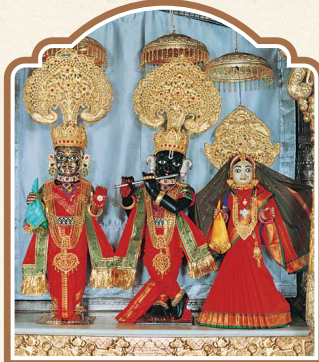
શ્રી મદમોહનજી મહારાજ - ધોલેરા